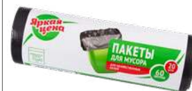
КОД 409166 ПАКЕТЫ ДЛЯ МУСОРА "ЯРКАЯ ЦЕНА" 60 ЛИТРОВ 20 ШТУК