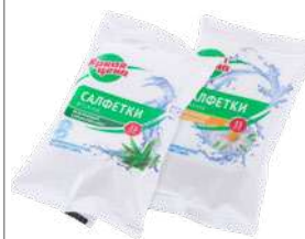
КОД 411921 САЛФЕТКИ ВЛАЖНЫЕ "ЯРКАЯ СЕМЬЯ" В АССОРТ. АЛОЭ, РОМАШКА 15ШТ