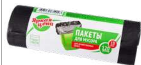
КОД 409167 ПАКЕТЫ ДЛЯ МУСОРА "ЯРКАЯ ЦЕНА" 120 ЛИТРОВ 10 ШТУК