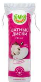
КОД 568126 ДИСКИ ВАТНЫЕ "СЕМЬЯ ДОВОЛЬНА" 80ШТ