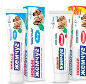
ПАСТА ЗУБНАЯ "НОВЫЙ ЖЕМЧУГ" КОД 80628 ФТОР КОД 80627 КАЛЬЦИЙ 125МЛ