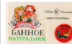
КОД 136577 МЫЛО ТУАЛЕТНОЕ "БАННОЕ" 140Г (НЕВСКАЯ КОСМЕТИКА)