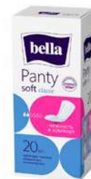
КОД 307425 ПРОКЛАДКИ ГИГИЕН. "BELLA PANTY" CLASSIC ЕЖЕДНЕВНЫЕ 20ШТ