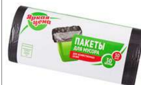
КОД 409164 ПАКЕТЫ ДЛЯ МУСОРА "ЯРКАЯ ЦЕНА" 30 ЛИТРОВ 30 ШТУК