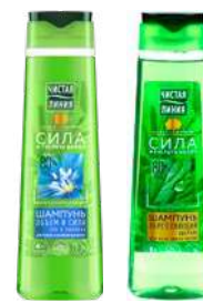
КОД 69391 ШАМПУНЬ "ЧИСТАЯ ЛИНИЯ" В АССОРТ. ОБЪЕМ И СИЛА (ЛЕН И ПШЕНИЦА), УКРЕПЛЯЮЩИЙ КРАПИВА (ДЛЯ ВСЕХ ТИПОВ ВОЛОС) 400МЛ