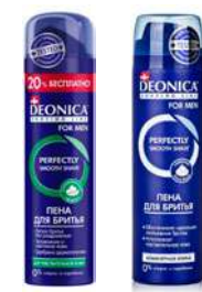
КОД 441849 ПЕНА Д/БРИТЬЯ "DEONICA" FOR MEN В АССОРТ. ДЛЯ ЧУВСТВИТЕЛЬНОЙ КОЖИ, КОМФОРТНОЕ БРИТЬЕ 240МЛ