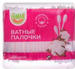
КОД 568128 ПАЛОЧКИ ВАТНЫЕ "СЕМЬЯ ДОВОЛЬНА" 200ШТ ПАКЕТ