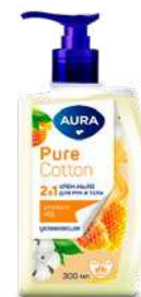
КОД 562106 КРЕМ-МЫЛО 2В1 ЖИДКОЕ "АУРА" ДЛЯ РУК И ТЕЛА ХЛОПОК И МЕД 300МЛ