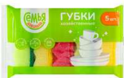
КОД 591484 ГУБКА ДЛЯ ПОСУДЫ ВОЛНА "СЕМЬЯ ДОВОЛЬНА" ЦВЕТНЫЕ 5ШТ